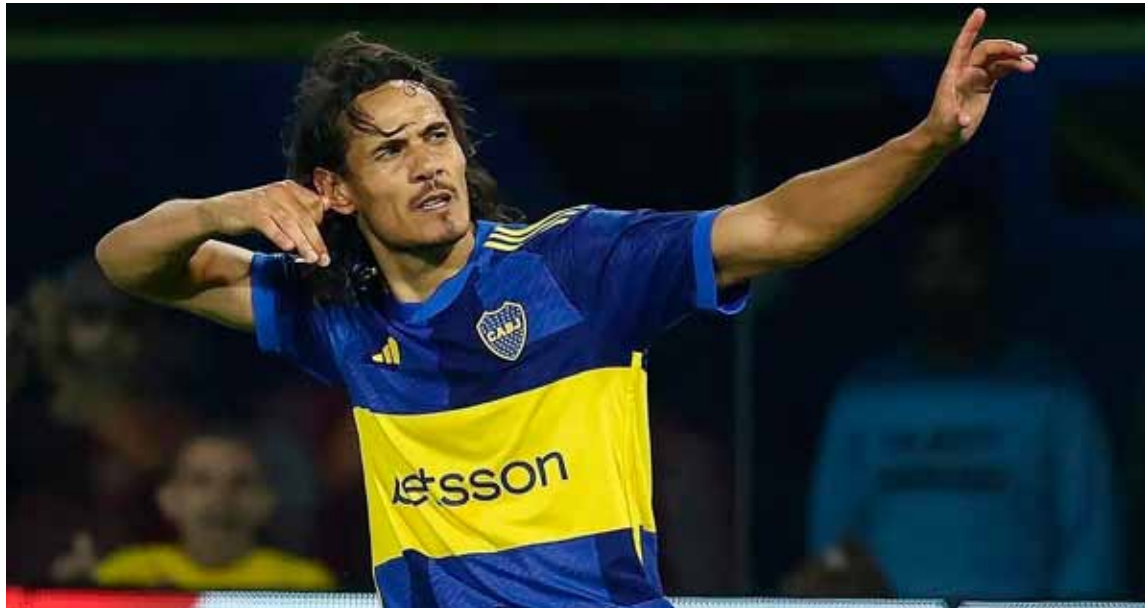
Goleador. El uruguayo Cavani, hoy será titular en La Bombonera

En el partido de ida de los octavos de final de la copa continental