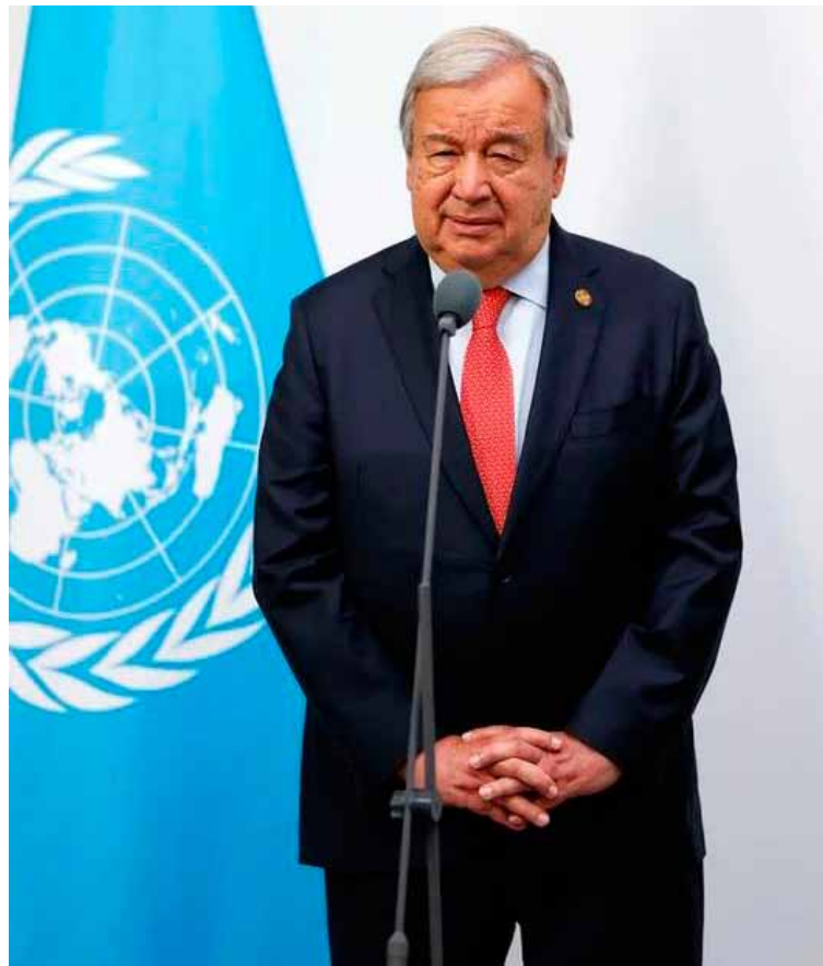
Postura oficial. El secretario general de la ONU António Guterres

Caracas cuestionó en un comunicado las opiniones de Turk relativas a las iniciativas legislativas del Parlamento venezolano sobre la regulación de organizaciones no gubernamentales y un