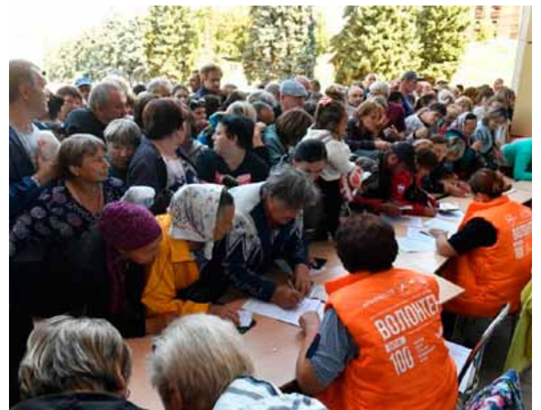
Asistencia. Personas reciben suministros de socorro, en Kursk, Rusia

La OMS declaró esta emergencia ya que los brotes no son consecuencia de la circulación de una misma variante del virus, sino de más de una. Asimismo, los especialistas médicos observaron niveles de riesgo y de contagio diferentes, mientras que hace dos años la transmisión era casi exclusivamente por vía sexual.///