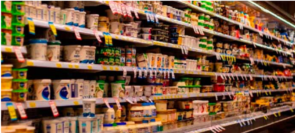
Desaceleración. En el incremento de los precios, según la información del Indec

El organismo dio a conocer los números del séptimo mes del año. Acumula un 263,4% interanual