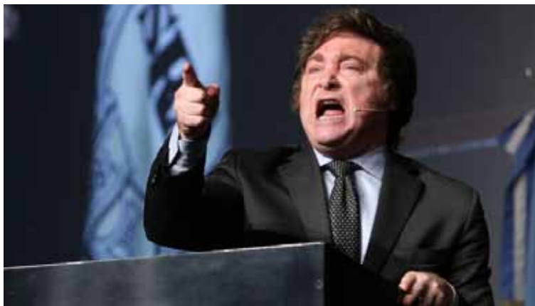
Definiciones. Del presidente, Javier Milei

Tras asegurar que el mundo habla del “milagro argentino”, Milei realizó un repaso de las medidas que tomó desde su llegada a la Casa Rosada, tras la herencia de la gestión de Alberto Fernández. “Era la suma de todos los males, una verdadera papa caliente”,