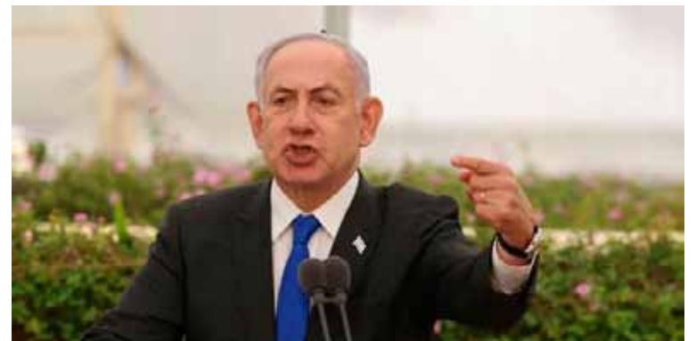
Decisión. Netanyahu aprobó envío de una delegación a Qatar

La oficina de Netanyahu dijo en un comunicado que la delegación saldrá este jueves rumbo a Doha con autoridad plena para negociar.