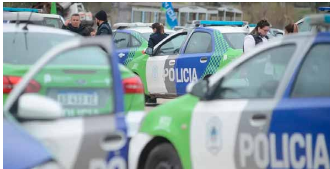
Despliegue policial. Luego de conocerse sobre el robo en la distribuidora

Un grupo de delincuentes robó en una distribuidora de productos alimenticios de La Plata y escaparon con herramientas y elementos de oficina. Por el momento, los malvivientes continúan prófugos.