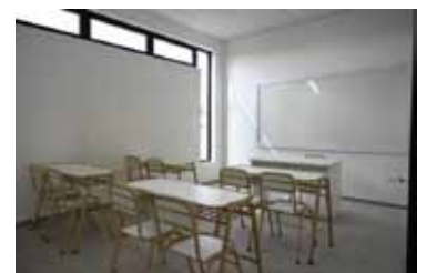
Escuelas. Abiertas durante el día de paro

La propuesta genera un rechazo significativo entre los gremios docentes y por fuerzas como Unión por la Patria y la izquierda, ya que consideran que busca restringir el derecho a huelga. (DIB)