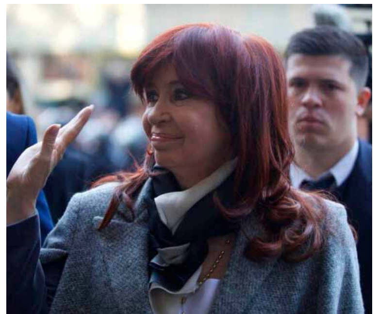
Declaración. De CFK, como testigo

Además, dijo: “Con la vida no, se ganan o se pierden elecciones, pero la vida del adversario no se ponía en juicio. Bastante ingenuidad la mía, porque debí haber advertido los cambios de época”. (DIB)